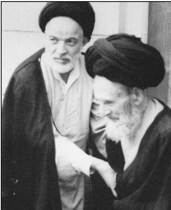
مرحوم آیت‌الله العظمی حاج سید احمد خوانساری و زنده‌نام مرحوم استاد سیدمرتضی جزایری

در حالی که رژیم، میدان را از مرجعی که پس از آیت‌الله بروجردی بتواند در برابر دولت عرض اندام کند، خالی تصور می‌کرد، عالمان قم و در رأس آن‌ها آیت‌الله خمینی هنگام آمدن شاه به قم از ملاقات با او سر باز زدند و در برابر شاه موضع گرفتند و چون دولت، آیت‌الله خمینی را دستگیر کرد، واقعه‌ی ۱۵ خرداد