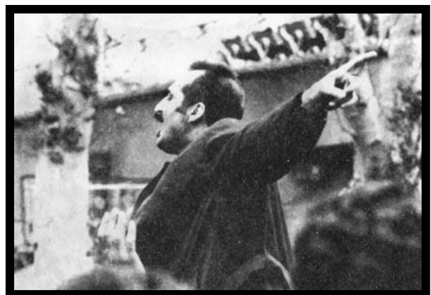
داریوش فروهر به‌هنگام تشییع جنازه‌ی استاد نجات‌الهی در میدان انقلاب

عنوان مقاله، از کتاب مرحوم جواهر لعل نهرو (نگاهی به تاریخ جهان)، در تحلیل انقلاب هند، اقتباس شده است و نه تنها شکوفایی آن انقلاب بزرگ و انقلاب ایران را به‌یاد می‌آورد، بلکه نشان‌دهنده‌ی این امر است که استمرار تکاملی دگرگونی‌های اجتماعی و سیاسی و فرهنگی، رهگشای سعادت و بهروزی انسان است، مشروط بر این که از آن دگرگونی‌ها (= انقلاب‌ها) علت‌ها و عامل‌ها و نیز پی‌آمدهای آن، شناخت درستی حاصل آید. واژه‌ی انقلاب در فرهنگ و ادب فارسی کهن مفهوم مثبت و معتبری نبوده است و در فرهنگ‌نامه‌ها «برگشتن از حالی به حالی» یا «تبدل از صورتی به صورت دیگر» را «انقلاب» می‌گفتند و «انقلابیون» را گاه در ردیف شورشگران به‌شمار می‌آوردند. ۱ روشن است که در مسیر زندگی «فردی و اجتماعی»، برگشت‌ها و تبدل‌ها که در جامعه به‌وقوع می‌پیوندند، گاه خوب و قابل قبول هستند و گاه