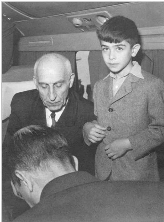
دکتر مصدق و نوه‌اش در راه سفر به لاهه

و پس ادعای شق اخیر خواهان اخذ غرامت است، در صورتی که ملی‌شدن در واقع قابل قبول شناخته شود، اما به واسطه‌ی عدم کفایت مبلغ قابل اعتراض باشد. اما نه در جمله‌ی امریه و نه در دلایل موجهی ادعای هیچ اعتراضی در مورد شرایط قانون که غرامت را پیش‌بینی کرده است، به‌عمل نیامده است و بدین نحو در تذکریه با دو ادعا از ادعاهای کهنه. یکی ادعای اصلی و دیگری