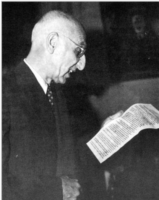
دکتر مصدق در دادگاه بین‌المللی لاهه، ۱۳۳۱

کفالت ریاست دیوان: از آقای دکتر مصدق نخست‌وزیر، تمنا می‌کنم بیانات خود را شروع فرمایند.