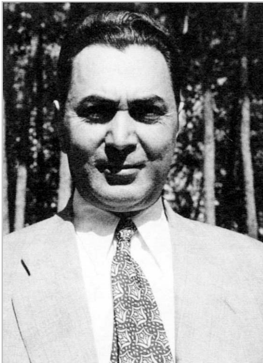
دکتر کریم سنجایی، قاضی ایرانی در دادگاه بین‌المللی لاهه

۵ - ادعای مبنی بر مبلغ گرامت در حق شرکت نفت ایران و انگلیس غیر وارد است، زیرا که شرکت مزبور هنوز به کلیه مراجع داخلی که قانون ایران مقرر داشته است، مراجعه ننموده است. ۶ - نظر به این که ایران و انگلستان در اعلامیه‌های خود مسابلی را که طبق حقوق بین‌المللی تابع قضاوت انحصاری دولت‌هاست، محفوظ داشته‌اند و این حفظ حقوق با در نظر داشتن این که ماده ۲ بند ۷ منشور ملل متحد جانشین ماده‌ی ۱۵ بند ۸ اساس‌نامه جامعه ملل است، باید چنین در نظر گرفته شود که شامل مسابلی است که اساساً تابع قضاوت داخلی دولت‌ها می‌باشد. نظر به این که اعلامیه‌های صریحی از این قبیل بلاشک مقررات عمومی ماده‌ی ۲ بند ۷ منشور سازمان ملل متحد را تقویت می‌کند و بنابراین دلیل دیگری برای اعلام عدم صلاحیت دیوان است.