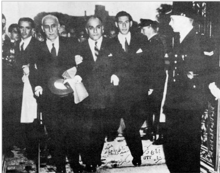
دکتر مصدق همراه با دکتر سعید فاطمی (منشی مخصوص مصدق در دادگاه لاهه) و دکتر غلامحسین مصدق هنگام ورود به دادگاه لاهه، ۱۹ خرداد ۱۳۳۱

باید اضافه کنیم که پُرارزش بود. پروفوسور لاتر پاخت استدلال نمود که تعبیر همیشه متضمن نیت طرفین است و قاعده‌ی متن واضح غیرواردات است و یک متن ممکن است ظاهراً واضح باشد، اما به‌طور مسلم و آشکاری به‌منظور طرفین لطمه بزند و نتیجه‌ی آن