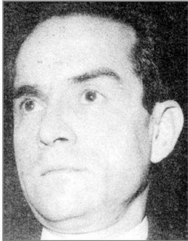
دکتر هادی هدایتی (وزیر بانفوذ کابینه هویدا)

به دلایل زیاد گفته شد باید یک شخصیت توانا و نویسنده و ادیب سرشناسی به این مسافرت برود، زیرا از یک طرف روابط بین شاهنشاه و چائوشسکو رهبر رومانی بسیار