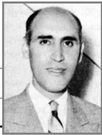
دکتر پرویز عدل