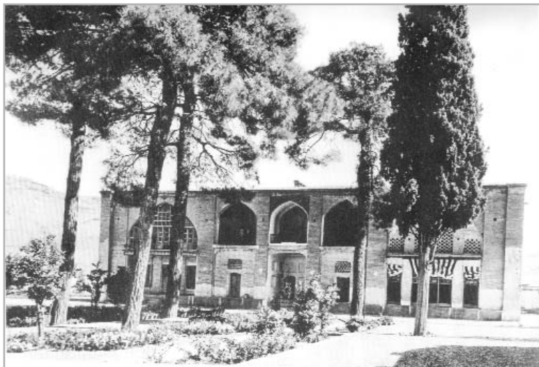
آرامگاه سعدی (در اوایل دوره پهلوی) برگرفته از «به یاد شیراز» از منصور صانع