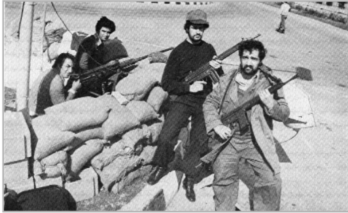
تدریجاً برخورد مسلحانه به خیابان‌های تهران کشیده شد

شاه با آن که دکتر بختیار را می‌شناخت و از طریق آموزگار و دیگران با او ارتباط داشت، اما نوشته است: «آقای شاپور بختیار یکی دیگر از اعضای جبهه‌ی ملی نیز وسیله‌ی رییس ساواک (مقدم) از من تقاضای ملاقات کرد... در حالی که آقای سنجابی به اشاعه‌ی