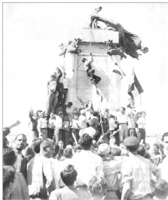
مجسمه‌های شاه در تهران و شهرستان‌ها سرنگون شد

بدین‌سان دکتر شاپور بختیار به‌هر دلیل خود با شاه رابطه داشت یا روابط برقرار کرد و سمت نخست‌وزیری را پذیرفت و به «جبهه‌ی ملی ایران» هیچ‌گونه ارتباط ندارد. خودش نیز نوشته است «من حمایت کلی جبهه‌ی ملی را از دست داده بودم». ۱۳