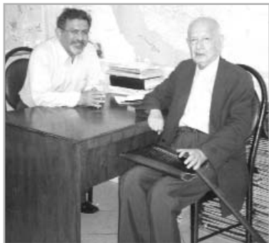
شاعر در دفتر ماهنامه‌ی حافظ: خرداد ۸۵

۱- مراد از برهان «تحویل» یا Conversion این است که هر شی در تجزیه و تحلیل، آخر سر، به مشتی «اطلاعات» با دانش برمی‌گردد و برهان تحویل را اولین بار خدا به ما الهام فرموده؛ ۲- کلمه‌ی «رع» را یهودی‌ها از روی کینه به پیامبر (ص) می‌گفته و معنی آن به فرانسه Salaud است! ۲- اخگر افشان برای «فشفشه».