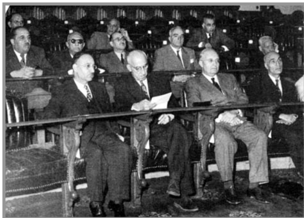
دکتر مصدق: معرفی وزیران به مجلس شورای ملی

- لایحه‌یی به مجلس تقدیم کرد تا جلوی رأی دادن بی‌سوادان را بگیرد که موفقیت‌آمیز نبود.