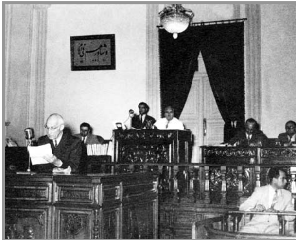
دکتر مصدق در حال نطق در مجلس

بقیایی را متهم کرد و به زاهدی اخطار نمود خود را معرفی کند. ولی زاهدی با موافقت کاشانی به مجلس آورده شد و آیت‌الله دستور داد از وی خوب پذیرایی کنند. اگرچه مهندس رضوی، نایب‌رییس مجلس، توانست ملاقات اشخاص خارج از مجلس را با زاهدی ممنوع کند. لطفی، وزیر دادگستری، طی نامه‌یی رسماً از مجلس خواستار سلب مصونیت دکتر بقیایی شد که این تقاضا نیز به تصویب نرسید، اما با تکیه بر اسناد قتل، مصدق شاه را متهم کرد که مخالفان دولت را تحریک کرده است و تهدید کرد اسرار ربودن افشار طوس را در اختیار جرایم می‌گذارد. شاه نگران، پیغام داد دخالتی در امور مملکتی نمی‌کند و ملکه ثریا را به اروپا می‌فرستد. مصدق هم اعلامیه‌یی می‌دهد. مخالفان عقب می‌نشینند و مجلس به فوریت طرح گزارش هیأت هشت‌نفره را به تصویب می‌رساند. هرچند، بقیایی دولت را متهم می‌کند که با حزب توده تیبانی کرده و قصد دارد سلطنت را ملغی سازد و کاشانی نیز مصدق را دیکتاتوری می‌خواند که قصد دارد «نهال آزادی و مشروطیت ایران را از بُن برکند.» و نخست‌وزیر را «باغی» می‌شمارد. تلاش مخالفان برای جلوگیری از ادامه‌ی کار مجلس باعث می‌شود که مصدق خود را برای انحلال مجلس آماده کند. اقدامی که به شدت مورد اعتراض کاشانی و بهبهانی قرار گرفت، اما نمایندگان طرفدار دولت استعفا دادند و مصدق مجلس را «کانونی برای پیشبرد مقاصد» بیگانگان خواند. «سی نفر از نمایندگان» از طرف «عوامل انگلیس» خریداری شده بودند و مذاکراتی برای خریداری عده‌یی دیگر در جریان بود. در واقع، مصدق با انحلال مجلس می‌خواست نقشه‌ی برکناری‌اش را خنثی کند. لذا در فرآیند صندوق‌های رأی مثبت و منفی در نقاط مختلف قرار داده شد و مردم پای صندوق‌ها رفتند. نتیجه مثبت بود.