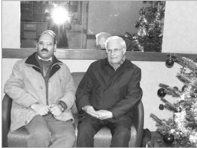
پروفسور فوشه کور - مترجم دیوان حافظ - دکتر کاووس حسن‌لی

شده است، ولی خط آن قدیمی مانده است. به همین دلیل است که در فرانسه چیزی نوشته می‌شود ولی طور دیگری خوانده می‌شود.