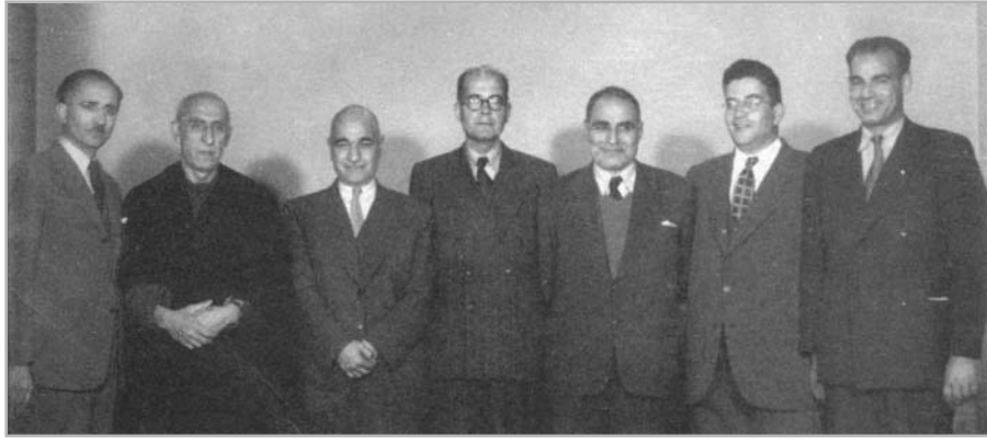
از راست: حسین مکی، دکتر مظفر بقایی، ابوالحسن حائری زاده، دکتر علی شایگان، عبدالقدیر آزاد دکتر محمد مصدق و الهیار صالح

به هر حال آزاد، چون تقاضایش دایر به این که از «حزب استقلال» (به رهبری آزاد) باید دو وزیر در کابینه‌ی ائتلافی به کار وارد شوند، مقبول مصدق واقع نشد، به مخالفت با دکتر مصدق پرداخت و از جمله از این که دکتر مصدق، داماد خود دکتر احمد متین‌دفتری ۸ را در خرداد ۱۳۳۰ برای خلع ید از شرکت نفت به جنوب فرستاده بود، در مجلس به او حمله کرد و سرانجام در ۱۶ تیر ۱۳۳۰ در رابطه با اسناد خانگی سدان در مجلس به مصدق